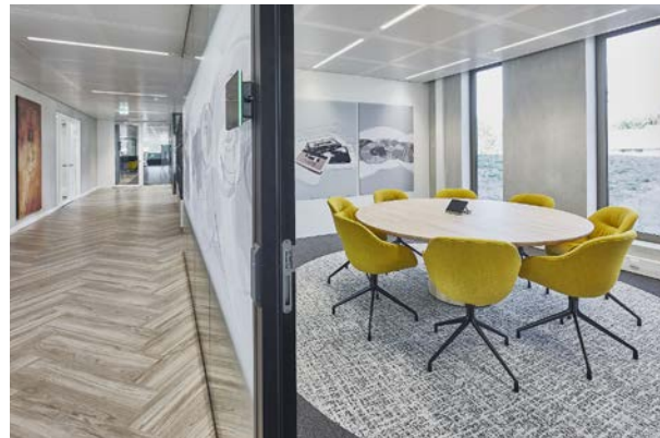
FOTO RECHTSONDER Een van de vergaderkamers, met afbeeldingen van cd's en cassettebandjes – een verwijzing naar Philips.

FOTO LINKSONDER Zicht vanuit de vide in het hart van het kantoor.