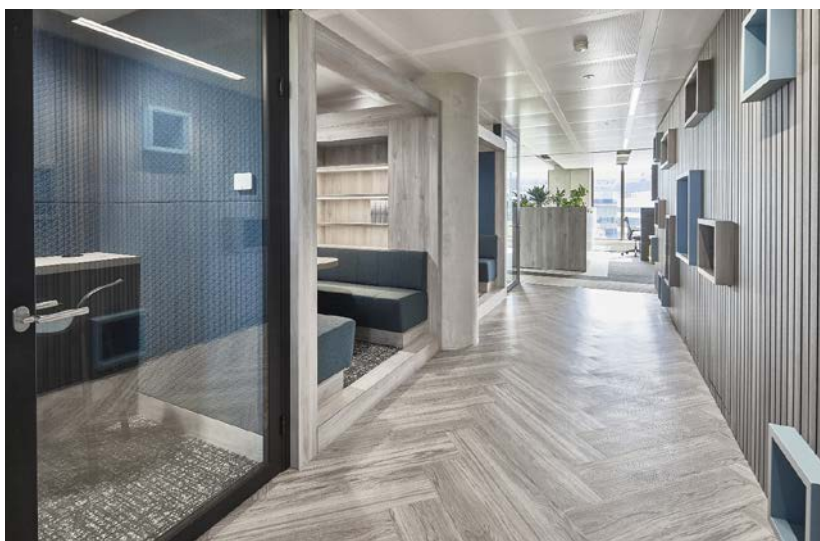
FOTO RECHTSONDER De lounge ruimte in de vide.